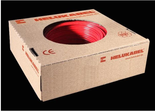
Bild 2: Kleinere Aderdurchmesser liefert HELUKABEL auch im praktischen 100-Meter-Ringkarton. Dies erleichtert das Handling und vereinfacht so die Maschinenverkabelung.